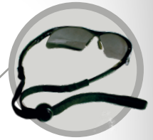
Incluye cordón ajustable.